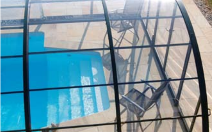
Dank des durchsichtigen Polycarbonats wirkt die Konstruktion filigran und transparent.

D iese Überdachung der Firma Ahtis steht in den Weinbergen in einem wunderschönen Tal in der Steiermark. Vier schiebbare Segmente und eine schwenkbare Vorderwand, Farbe Grün pulverbeschichtet, überspannen den Pool. Dank der komfortablen Schienen sind sie leicht zu bewegen. Gerade in dieser Region, in der gerade in den Hanglagen häufig sehr starke Winde auftreten, findet man nicht nur sehr viele Pools, sondern auch ebenso viele Überdachungen. Wie üblich ist der Hang terrassenförmig angelegt. Eine sehr enge Straße führt hinunter zum Ferienhaus der Besitzer. Hinter dem Haus bietet ein großzügiger Garten genügend Platz für eine Terrasse, die nicht direkt hinter dem Haus beginnt, sondern an die Mauerkante herangebaut wurde. Der Vorteil: Von der Terrasse hat man nun einen wunderschönen Blick zu den Bergen und hinunter ins Tal. Und natürlich auf den Pool mit Überdachung, der sich eine Etage tiefer auf dem Plateau befindet.