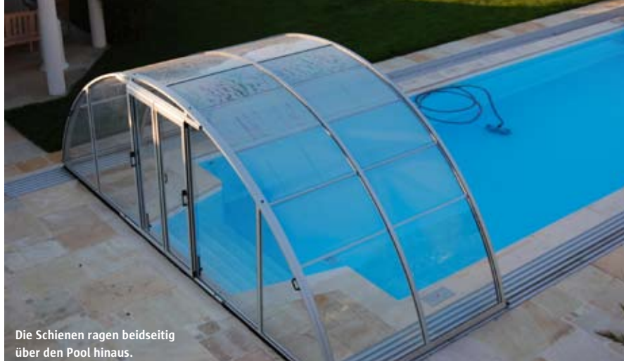
Die Schienen ragen beidseitig über den Pool hinaus.

F ast erscheint die Pool-Überdachung ein wenig zu mächtig. Der Besucher auf der Terrasse wundert sich. Von der Terrasse im ersten Stockwerk des Wohnhauses gelegen hat man einen guten Blick über den Garten, den Pool und natürlich über die Schiebehalle, die über dem Becken thront. Von hieraus führt eine geschwungene Treppe hinunter in den Garten und zu dem Badeparadies. Nein, erklärt der Bauherr entschieden, ein Arzt aus Deutschland, der sich hier in der Nähe von Graz sein Wochenenddomizil geschaffen hat. Die Anlage ist nicht zu groß geraten. Hier hat er Zeit und Muße, sich zu entspannen und die Wochenenden mit seiner Familie verbringen zu können. Gerade die Stunden mit den Kindern sind ihm wichtig. Und in dem 10 x 4 m großen Pool hat er genügend Platz zum Schwimmen und mit den Kindern zu spielen. Die Überdachung ist 12,70 m lang und 5,50 m breit. Der Vorteil: Auf der riesigen Terrasse hatte auch ein entsprechend großer Pool Platz, und sie überspannt nicht nur das Becken von einem Ende zum anderen, sie bietet noch einen 1,20 m großen Vorraum, der als Umkleide- und Aufenthaltsbereich genutzt